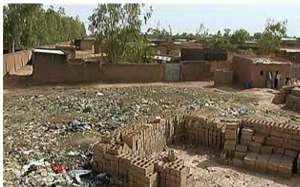
quartiere e casa di Aïcha

Compito: scrivi una breve lettera a Aïcha, nella quale: